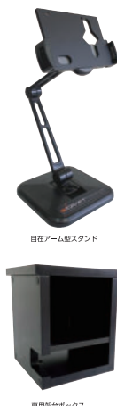
自在アーム型スタンド