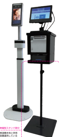
伸縮型スタンド部分 検温機本体と別用 図像を用いている イメージ写真です。